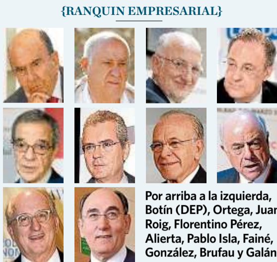
Por arriba a la izquierda, Botín (DEP), Ortega, Juan Roig, Florentino Pérez, Alierta, Pablo Isla, Fainé, González, Brufau y Galán.

Inditex vuelve a situar a su fundador, Amancio Ortega, y a su presidente, Pablo Isla, en el top ten de las figuras empresariales más relevantes en el estudio KAR de Ipsos. Realizado entre mayo y junio, el recientemente fallecido líder del Santander, Emilio Botín, salió primero con el 52% de apoyo, por un 48% de Ortega. Tercero es Juan Roig, de Mercadona (21%), cuarto el líder de ACS, Florentino Pérez (16%) y quinto el de Telefónica, César Alierta (15%). Isla es sexto y el presidente del Grupo La Caixa, Isidro Fainé, séptimo, con más del 10% de los votos. El chantadino titular del BBVA, Francisco González es 8º, noveno el de Repsol, Antonio Brufau, y cierra el 'top ten' el de Iberdrola, Ignacio Sánchez Galán.